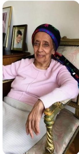
Princess Sophia in Geneva, Switzerland ልዕልት ሶፍያ በጄኔቫ