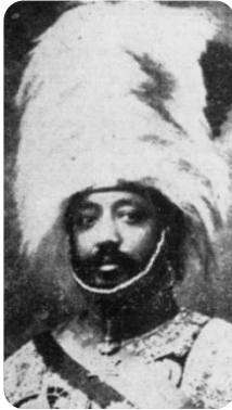
Ras Desta Damtew