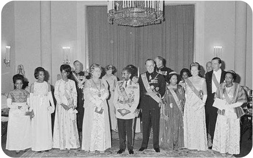
Princess Sophia with His Majesty & the Imperial Ethiopian family hosting the Royal House of the Netherlands (c. 1970s)

ልዕልት ሶፊያ ከግርማዊ ጃንሆይ እና ንጉሣዊ ቤተሰብ ጋር የኔዘርላንድስ ንጉሣዊ ቤተሰብን ባስተናገዱ ጊዜ።