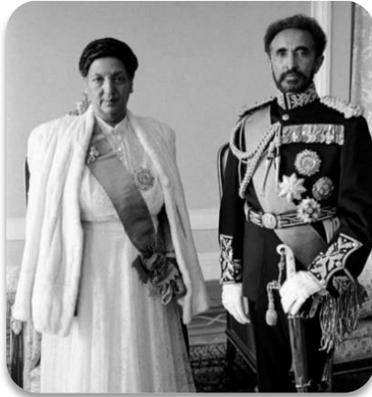
Emperor Haile Selassie & Etege Menen