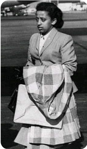
Princess Sophia returning to Ethiopia from school in the UK ልዕልት ሶፍያ ከውጭ ሀገር ትምህርት ሲመለሱ።