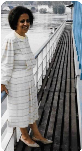
Princess Sophia in Rome on holiday ልዕልት ሶፍያ በሮማ